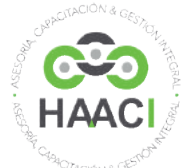
Educación profesional internacional