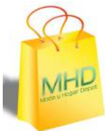
Ventas de Gadgets