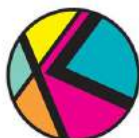
Ventas de accesorios para mujeres