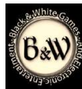
Mayor de video juegos y consolas